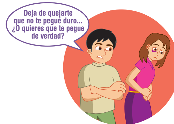
PEGAR - GOLPEAR - PATEAR