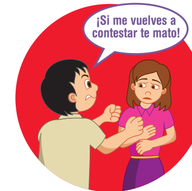
AMENAZAR DE MUERTE