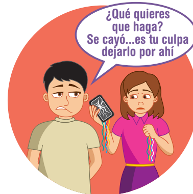
DESTRUIR OBJETOS PERSONALES