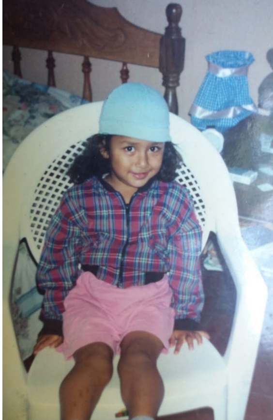
Alejandra González / © UNFPA 2019