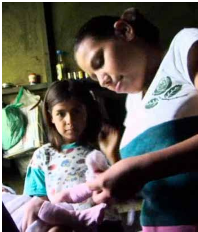
Los Spots para la prevención del embarazo en adolescentes se encuentran disponibles en: http://www.unfpa.org.ni/videos/

Así mismo, como parte de las actividades de la campaña también se pautaron en televisión nacional, spots que resumen dos historias de vida con mensajes para la prevención durante la proyección de la serie nacional Loma Verde, teniendo como un impacto promedio de 37,654 personas.