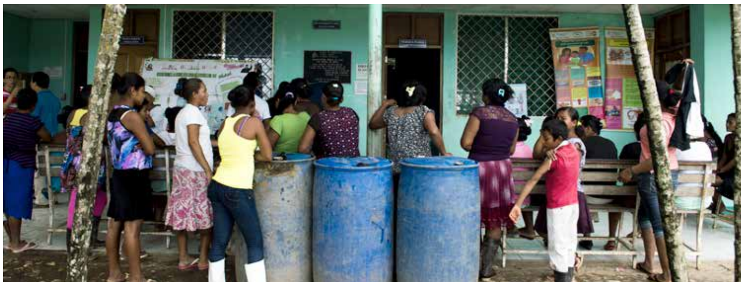
Foto: UNFPA - Orlando Rizo (2015). Mujeres, niños y niñas de San Andrés de Bocay y otras comunidades del Río Coco y del Río Bocay, esperando ser atendidas por los brigadistas que llegaron a la comunidad en Septiembre de 2015.

Así mismo, gracias a la participación comunitaria y la coordinación con las instituciones de gobierno indígena, se logró la organización de tres casas maternas, en San Andrés, Amak y Raití. En estas casas maternas se espera recibir a mujeres embarazadas cuyos partos serán atendidos en las sedes territoriales. Así mismo, las mujeres durante el puerperio, el período de 40 días posteriores al parto, podrán mantenerse hospedadas en estas instalaciones.