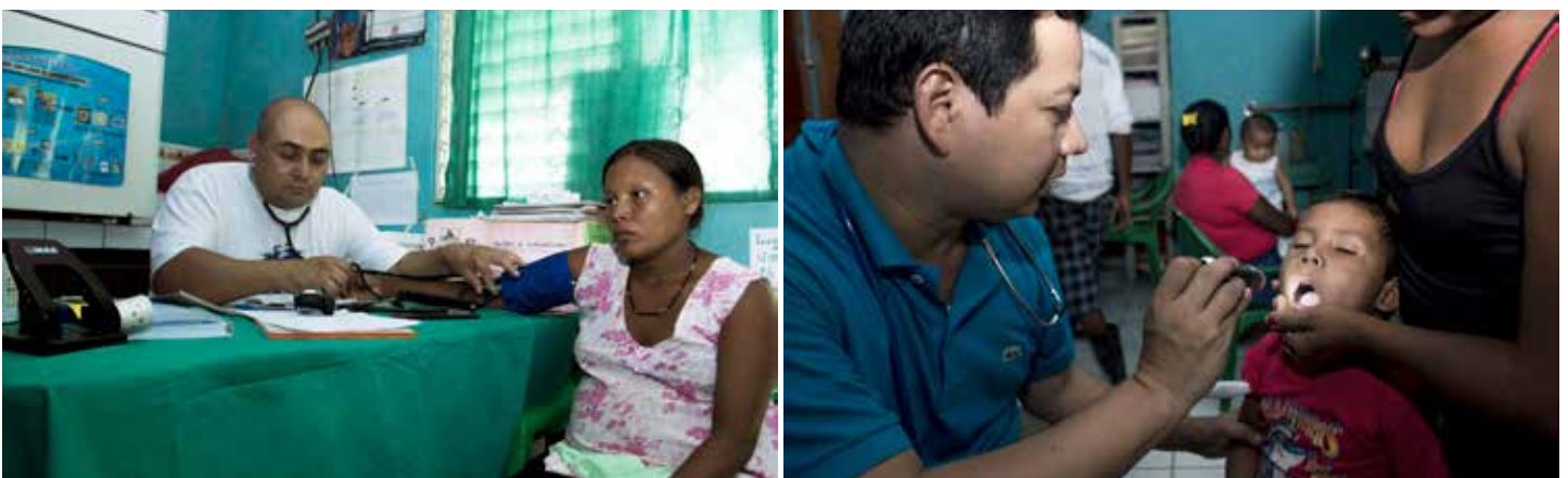
Foto: UNFPA - Orlando Rizo (2015). Parte del equipo de la brigada médica que atendió a cientos de pobladores del Alto Wangki Bocay en Septiembre de 2015.

El componente de salud del Programa tomó especial relevancia dada las características de la zona. Remota, de difícil acceso, con comunidades viviendo en pobreza, el mejoramiento de los sistemas de atención institucional en salud fue una prioridad. El Programa facilitó la asistencia de una brigada médica que viajó desde el municipio de El Cuá, en el departamento de Jinotega hasta San Andrés para atender a la población. Internista, ginecólogo, pediatra y médicos generales se movilizaron a la comunidad, donde atendieron a comunitarios de poblaciones alejadas, como Siksa Yahri y Arandak, en el Puesto de Salud Familiar y Comunitaria de esta comunidad.