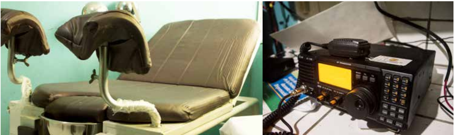
Equipos entregados por el Programa Conjunto de Seguridad Humana a distintos puestos de salud en el Alto Wangki Bocay.