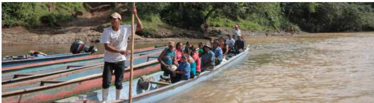
El único medio de transporte al que los pobladores del Alto Wangki Bocay tienen acceso es en bote por río. Esto hace necesario el fortalecimiento de las capacidades para la atención en los puestos de salud que el MINSA maneja en la zona.

Adicionalmente, se realizaron 3 ferias informativas en las comunidades de los territorios de Amak, Raiti y San Andrés. Se trabajó con grupos de jóvenes que presentaron actos teatrales sobre temas relacionados con la violencia de género y se distribuyó material informativo sobre los derechos de la mujer y su salud sexual y reproductiva. Igualmente se presentaron números musicales y discursos de los líderes comunitarios y representantes de las instituciones de educación y salud, con relación a estos temas.