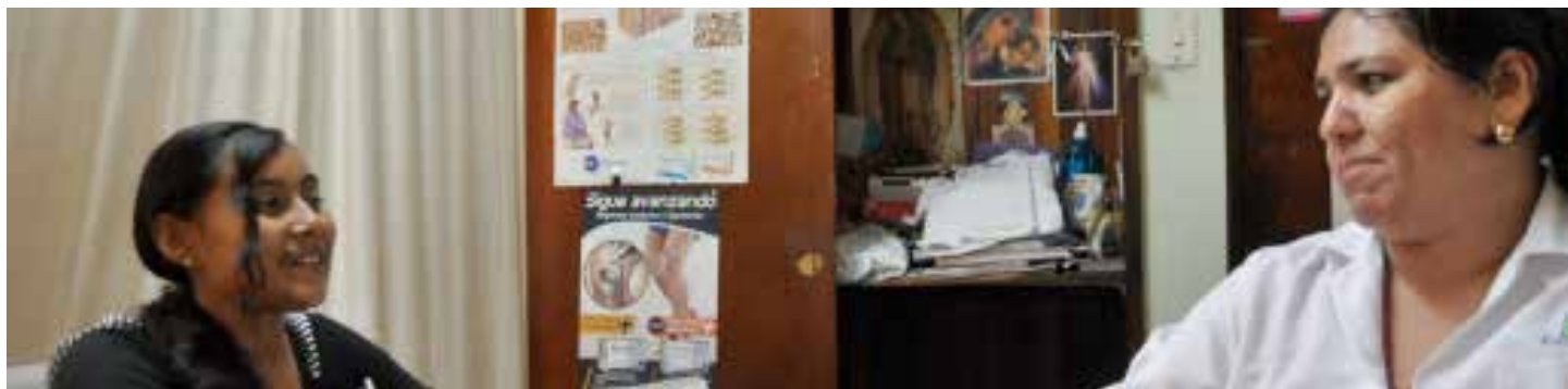
Foto: UNFPA - Orlando Rizo (2014). Adolescente recibiendo Consejería sobre salud sexual y reproductiva

UNFPA colaboró técnicamente con el Ministerio de Salud para la formulación de la nueva norma de Planificación Familiar (PF) que se publicó en diciembre de 2015. La versión anterior era del año 2008. La Norma de Planificación Familiar establece lineamientos generales para la atención de calidad y estandarizar criterios médicos de elegibilidad para el uso de métodos anticonceptivos. También fomenta la aplicación de protocolos basados en mejores evidencias científicas disponibles y está basada en el método científico aplicado en la atención en salud.