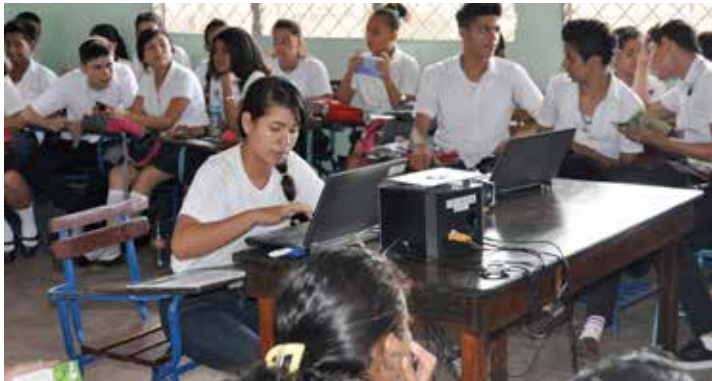
Estudiantes de secundaria asistieron a la presentación de la Red de Centros de Documentación de la Mujer y la Niñez.