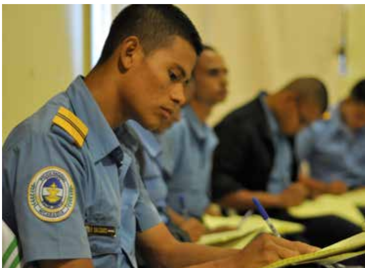
Foto: UNFPA - Claudia Porras (2015). Cadete de la Academia de Policía recibe capacitación sobre educación integral de la sexualidad.

“Las instituciones nacionales y locales fortalecen su capacidad para aplicar una educación y asesoramiento amplios en materia de sexualidad, incluida la prevención del VIH, para jóvenes y adolescentes”. Programa de Cooperación de UNFPA con Nicaragua, 2013-2017.