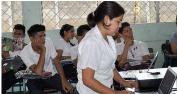
Foto: RECIMUNI (2015). Más de 800 estudiantes de secundaria participaron en las presentaciones lideradas por UNFPA.

La Red de Centros de Información de la Mujer y la Niñez, RECIMUNI, promovió la gestión de información e intercambio de conocimientos con adolescentes de distintos centros educativos de secundaria, llegando a más de 800 estudiantes. En estas actividades se les presentó la Biblioteca Virtual de UNFPA, como herramienta para la búsqueda de documentos e información, oportunidad que fue aprovechada por las y los jóvenes para interactuar con el sitio web y brindar sus aportes y comentarios sobre el contenido de la misma.