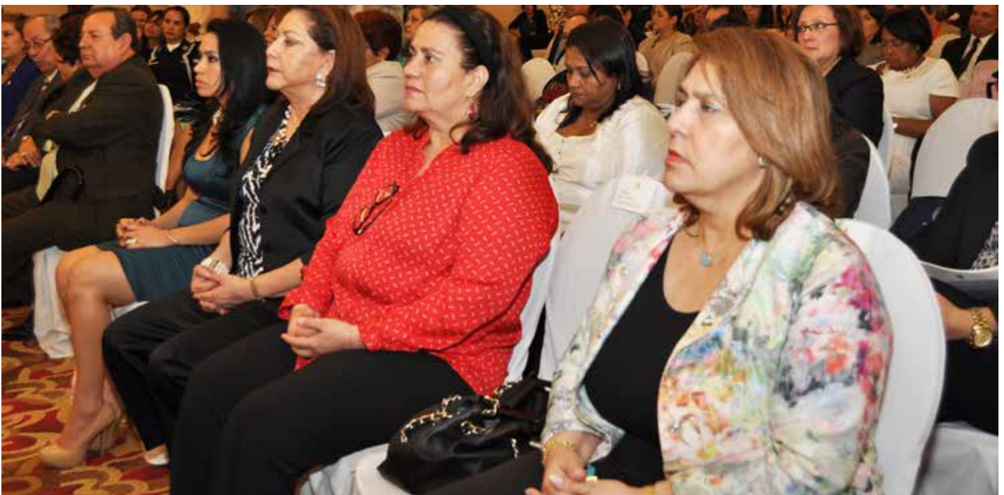
Foto: UNFPA - Claudia Porras (2014). Funcionarios/os del Poder Judicial recibieron capacitaciones y equipos para brindar atención especializada a mujeres víctimas de violencia de género.

El personal capacitado (Secretarías/os y Asistentes de los Juzgados Especializados en Adolescentes y Violencia de Género, encargados de estadísticas, fiscales especializados entre otros) sobre el manejo del Sistema Estadístico de Violencia, iniciaron el llenado de información para elaboración de los reportes que alimentan dicho sistema del Observatorio administrado por el Poder Judicial. Igualmente se fortalecieron las capacidades operativas del Ministerio Público a través de la entrega del equipamiento informático para el registro de las estadísticas institucionales y generación de la información estadística por medios informáticos.