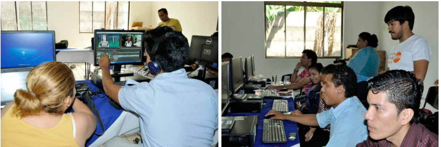
Foto: UNFPA - Claudia Porras (2015). Promotores del Ministerio de la Juventud durante un taller para el desarrollo de habilidades en producción audiovisual.

El abordaje de estos temas por parte de adolescentes y jóvenes aportará a visibilizar en la agenda pública la prevención del embarazo en adolescentes, destacando la formulación de un plan de vida, la prevención de la violencia y del VIH, de forma que se visualice la importancia de contar con información y servicios de salud sexual y reproductiva para adolescentes y jóvenes.