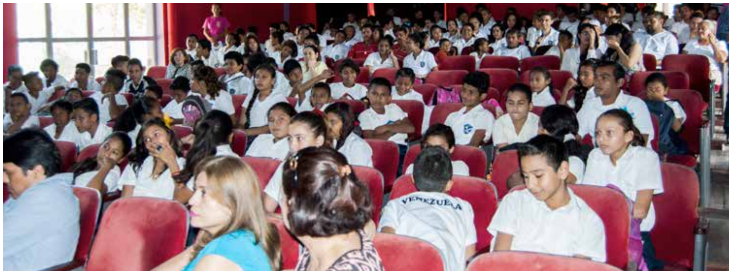
Foto: UNFPA - Claudia Porras (2015). Estudiantes de secundaria de distintos institutos de Managua durante la inauguración del Ciclo de Cine Foro, que se realizó en 10 municipios del país.