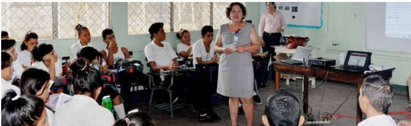
Estudiantes de secundaria durante la presentación de la Biblioteca Virtual de UNFPA, repositorio digital con cientos de publicaciones sobre adolescentes, jóvenes, derechos sexuales y reproductivos, entre otros temas.

A través de RECIMUNI distintas Bibliotecas y Centros de Documentación participaron en la Feria Informativa del Día Internacional de la Mujer y en la Feria realizada en la UNI para conmemorar el Día Mundial de la Población, donde se realizó asimismo la exhibición fotográfica "Managua en el Recuerdo", de la Alcaldía de Managua.