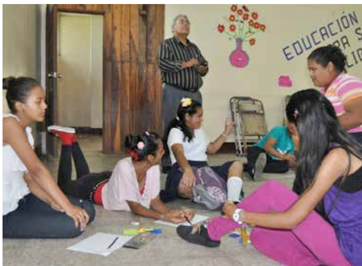
Foto: UNFPA - Claudia Porras (2014). Promotores del Ministerio de la Juventud durante un taller de capacitación.