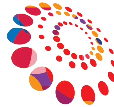
Tercera Reunión de la Conferencia Regional sobre Población y Desarrollo de América Latina y el Caribe

Tanto la Agenda 2030 y sus Objetivos de Desarrollo Sostenible como Programa de Acción de la CIPD después del 2014 parten de la premisa de que el desarrollo económico debe sincronizarse con el desarrollo humano, y con la sostenibilidad del medio ambiente y sus recursos naturales. El Consenso de Montevideo combina el desarrollo económico con el desarrollo humano, los derechos humanos y el respeto del medio ambiente y propone el desarrollo de políticas que respondan a asuntos poblacionales urgentes como la salud sexual y reproductiva; el envejecimiento de la población; la niñez, la adolescencia y la juventud; la igualdad de género, la migración internacional; la desigualdad territorial, la movilidad espacial y la vulnerabilidad; la inclusión igualitaria de los pueblos indígenas y la población afrodescendiente y el combate al racismo y la discriminación racial.